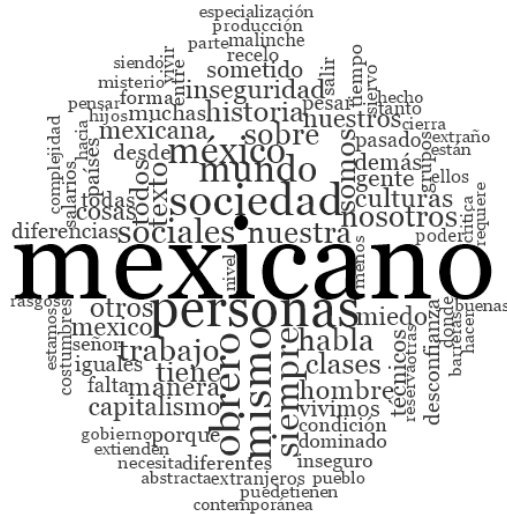
Figura 3. Conceptos más relevantes que emergen de las ideas de los estudiantes

Al estudiar la influencia disciplinar para la adquisición global de la comprensión lectora que implica los cinco niveles evaluados, la prueba de H de Kruskal-Wallis arroja una diferencia significativa p < .001 , entre las áreas de conocimiento. En el caso de la adquisición en cada uno de los cinco niveles de comprensión lectora, la prueba a un nivel de significancia de \alpha = .05 arrojó una diferencia significativa en dos de los niveles (literal y crítico) mientras en los otros tres las diferencias no fueron significativas, tal como se aprecia en Tabla 2.