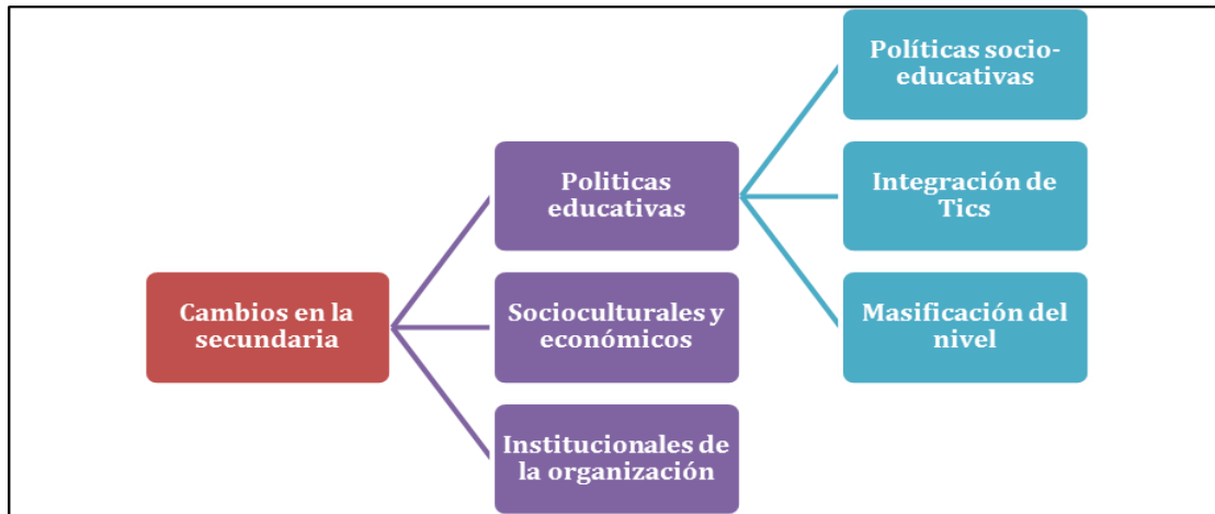
Figura 1. Categorías pregunta abierta: Transformaciones del nivel secundario

Las preguntas abiertas se categorizaron a posteriori , a través de la lectura minuciosa de las respuestas y la realización de sucesivos agrupamientos con la ayuda del Atlas.ti, hasta que se obtuvieron los códigos definitivos (ver figuras 1 y 3). Se consideró la frecuencia en las preguntas de opción múltiple y la cantidad de menciones de las categorías definidas en las abiertas, en este caso se analizó la jerarquía, es decir, los códigos con mayores o menores menciones, cantidad de referencias (citas) en las respuestas vertidas por los profesores.