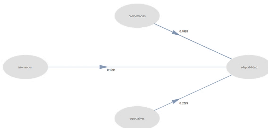
Figura 2. Coeficientes de ruta del modelo

Los resultados de la regresión de cada variable endógena (tabla 10) fueron significativos para todos los casos (valores t alejados de 0 y puntuaciones Pr(>|t|) próximas a 0).