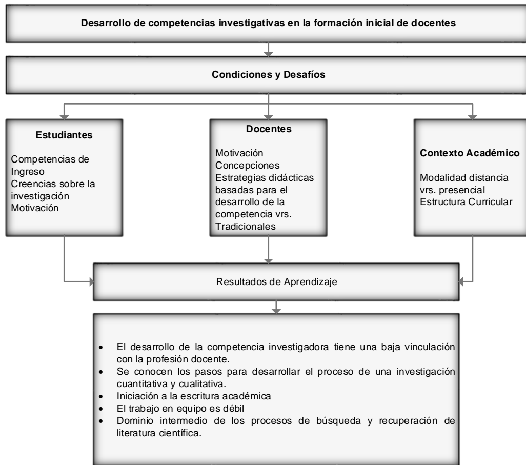
Figura 2. Mapa de conjunto que detalla la vinculación entre las categorías del estudio

Componente cuantitativo: factores del contexto universitario y del docente.